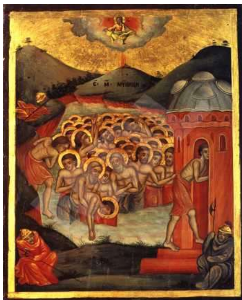
Св. Четиридесет мъченици Севастийски

пример, и който сега ще ви кажа. А какво направили? Четиридесет души, някои млади, други стари, един до друг, подкрепяйки един другото проявили търпение вътре в заледеното езеро. А кое е второто, което направили? Запазили православната си вяра, когато римляните им казвали: „Само едно „сгреших“ да кажете, леко да повдигнете ръката си нагоре и да кажете: искам да отида да се стопля на огъня...“, който били запалили наблизко тези злодейци, римските идолопоклонници. Запалили огън, както ви казах, и отивали да се топят римляните, които пазели четиридесетте „злодейци“, сякаш те са могли да избягат от замръзналото езеро. А за да е заледено езерото в Севастия в Мала Азия, би трябвало да е поне 30 градуса под нулата (градът е в планинска долина на 1280 м. надморска височина; през зимните месеци декември-март са отбелязвани температурни рекорди от около минус 30° С, б. р.). И нашите светци вътре в него да мръзнат, да замръзват голи, а другите се топлели и им казвали: „Който изгуби търпението си и иска да стане от християнин идолопоклонник, да вдигне ръката си и ще дойдат войниците да го вземат и отведат при огъня да се стопли.“ От всички само един вдигнал ръка, изгубил търпението си, изгубил вярата си. И го сложили до