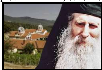
Св. Яков Цаликис

Свети Яков (Цаликис) от остров Евбея ми казваше: „И страстите ни си искат своето време, Неофите!“ и ми намигваше. И за наследствените, които сме приели от родителите си, дядовците и бабите си, но и тези, които сме придобили по-късно с