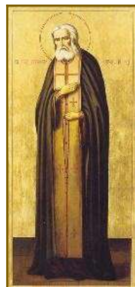
Св. Серафим Саровски

Виждате ли?! Светият човек не обижда. Помага на другите да се покаят. И така, този Божи човек се издигна на много високо духовно равнище. Достигна до такава степен, че самата света Богородица го нарече приятел на Сина и нейн приятел. Веднъж и се оплакал, че го болели краката от разширените вени, от което страдал, и отишъл да и ги покаже. И веднага му се явила света Богородица, заедно със свети Серафим Саровски и свети Йоан Богослов, двамата големи нейни приятели и представила на двамата светци новия светец. И казала: „Йоане Богослове и ти, свети Серафиме Саровски, светци мои и приятели на Сина ми, този тук, когото виждате с голите окървавени крака, е приятел на Сина ми и избран мой приятел, и искам да го излекувате!“ И единият светец, се казва, помазал единия му крак с елей, донесен от небето, а другият светец – другия крак. И го попитах: „Оздравя