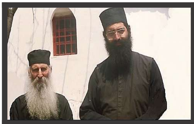
Св. Яков и митр. Неофит на Морфу

епархия), имате отговорността да намерите всеки от вас в обкръжение си – ти, отец Атанасий в селото си в Какопетря, а ти, сестра Исидора – сред поклонниците, които знаеш, че идват тук (има предвид манастира „Св. Богородица Хрисокурдалъотиса“ при